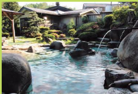
※お風呂は24時間入浴可能。