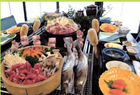
※料理の写真はイメージです。